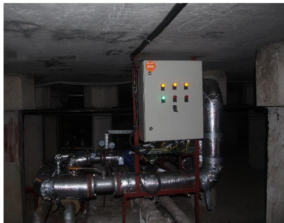
Дмитровское шоссе, 155к3