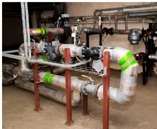
Ленинский проспект, 121/1к3

Принцип работы АУУ позволяет исключить данную ситуацию и заключается в следующем. Теплоноситель, поступающий в дом, движется через АУУ. «Умное» оборудование производит сравнение фактической и заданной температуры теплоносителя. Если температура снаружи дома повышается, то с помощью насосов производится смешение теплоносителя из обратной магистрали (уже отдавшего тепло для отопления дома) с теплоносителем из подающей магистрали, благодаря чему температура теплоносителя снижается. Таким образом, температура в помещениях многоквартирного дома комфортна для жителей и соответствует установленным нормативам, а избыточная тепловая энергия не потребляется и, соответственно, не оплачивается.